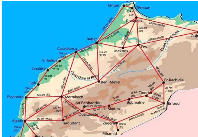
Figure 1 : Extrait du réseau routier du Maroc